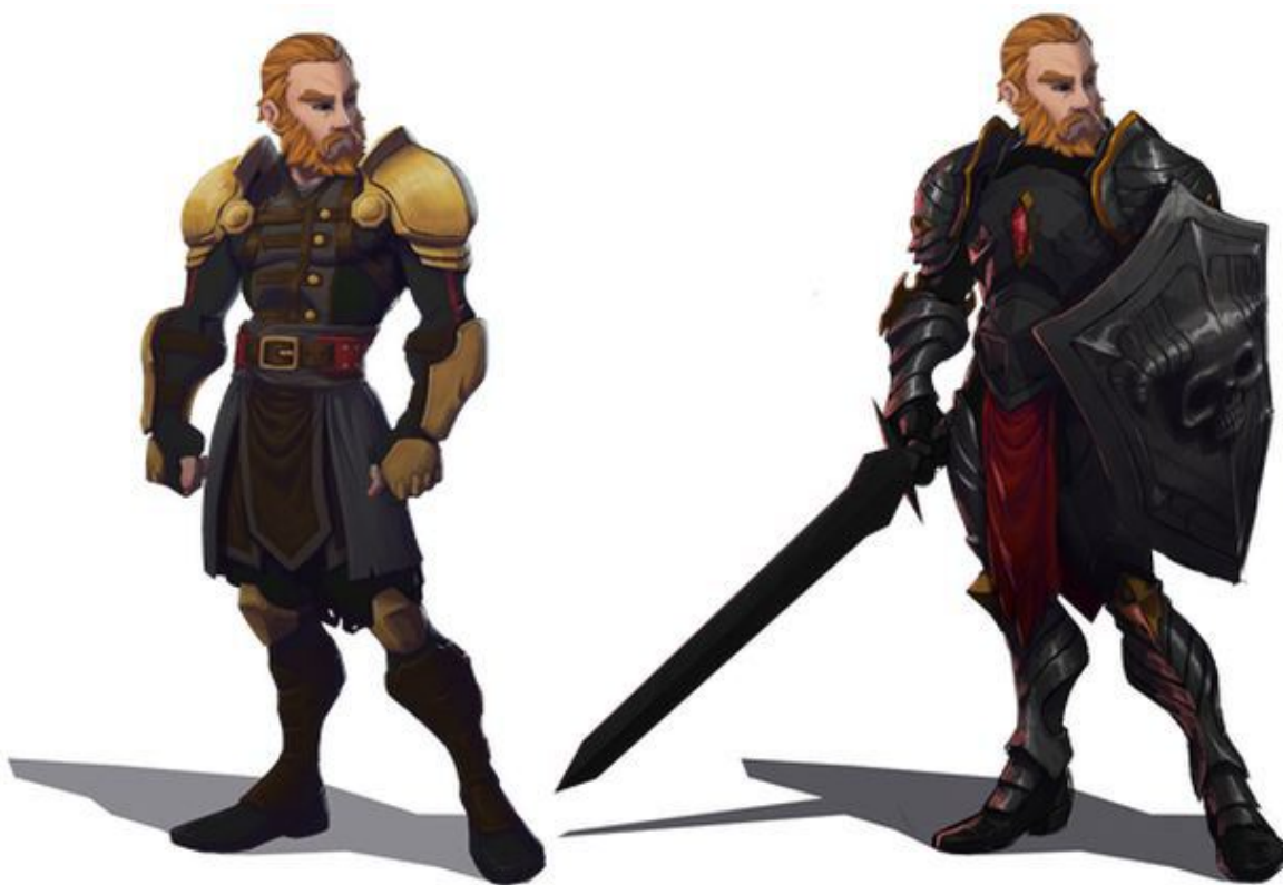
Estudo de arte do Personagem

Os desenvolvedores da empresa Insane estão desenvolvendo o primeiro MMORPG totalmente sandbox, chamado O Profane . Neste jogo os jogadores terão liberdade total, PvP livre, sistemas de vilas e cidades construídas. Além disso, existe a possibilidade de coletar recursos da natureza para a construção de abrigos para proteção de seus itens em baús. Estes abrigos podem ir desde casebres simples até castelos.