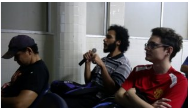
Alunos fazem perguntas e reflexões