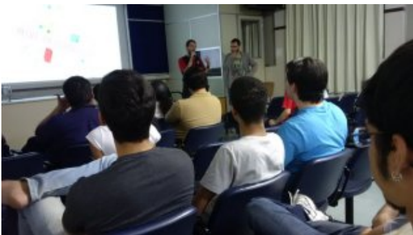
Evento promove discussão sobre playble city