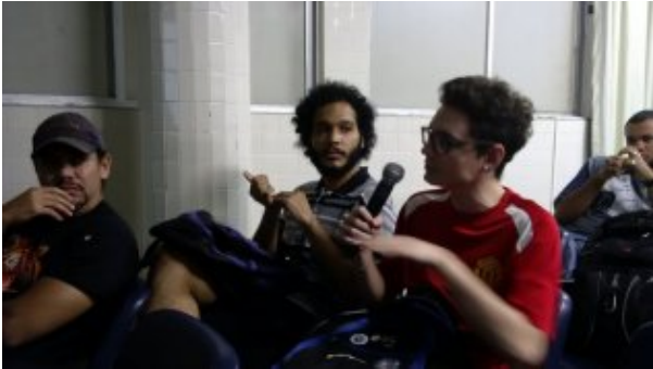
Alunos fazem perguntas e reflexões