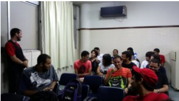
Alunos fazem perguntas e reflexões