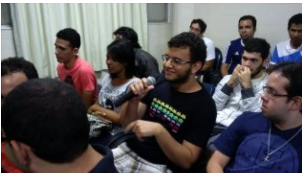
Alunos fazem perguntas e reflexões