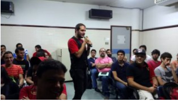
Bate papo sobre diversão e tecnologia