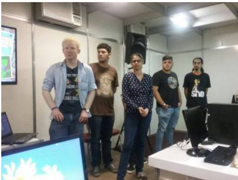
Apresentação do eBook gameficado da Turma do Manguetal