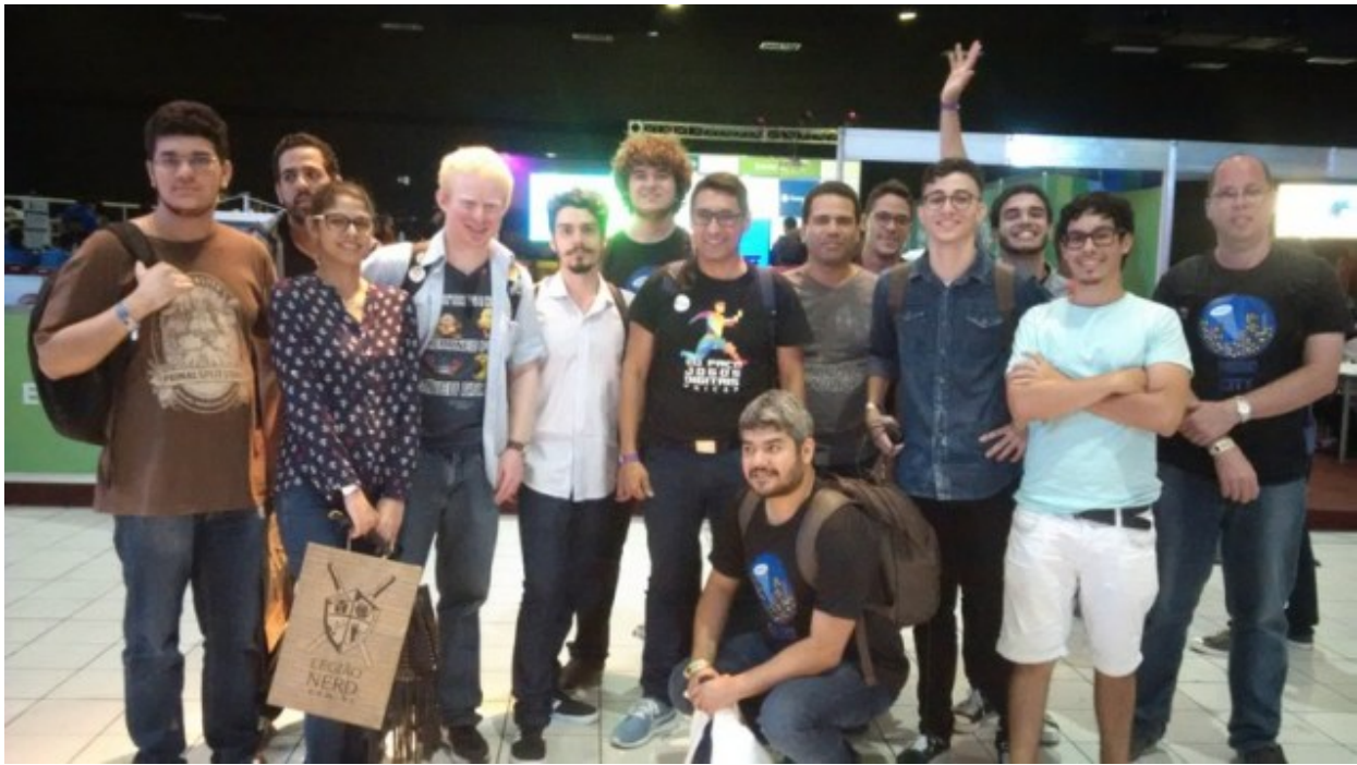
Alunos, professores e egressos do Curso de Jogos Digitais participam da Campus Party Recife 2016