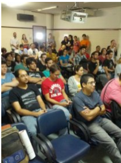
Auditório lotado para acompanhar o evento