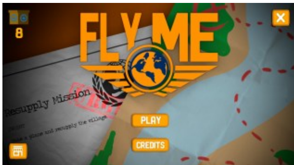
Tela Inicial do Jogo Fly Me