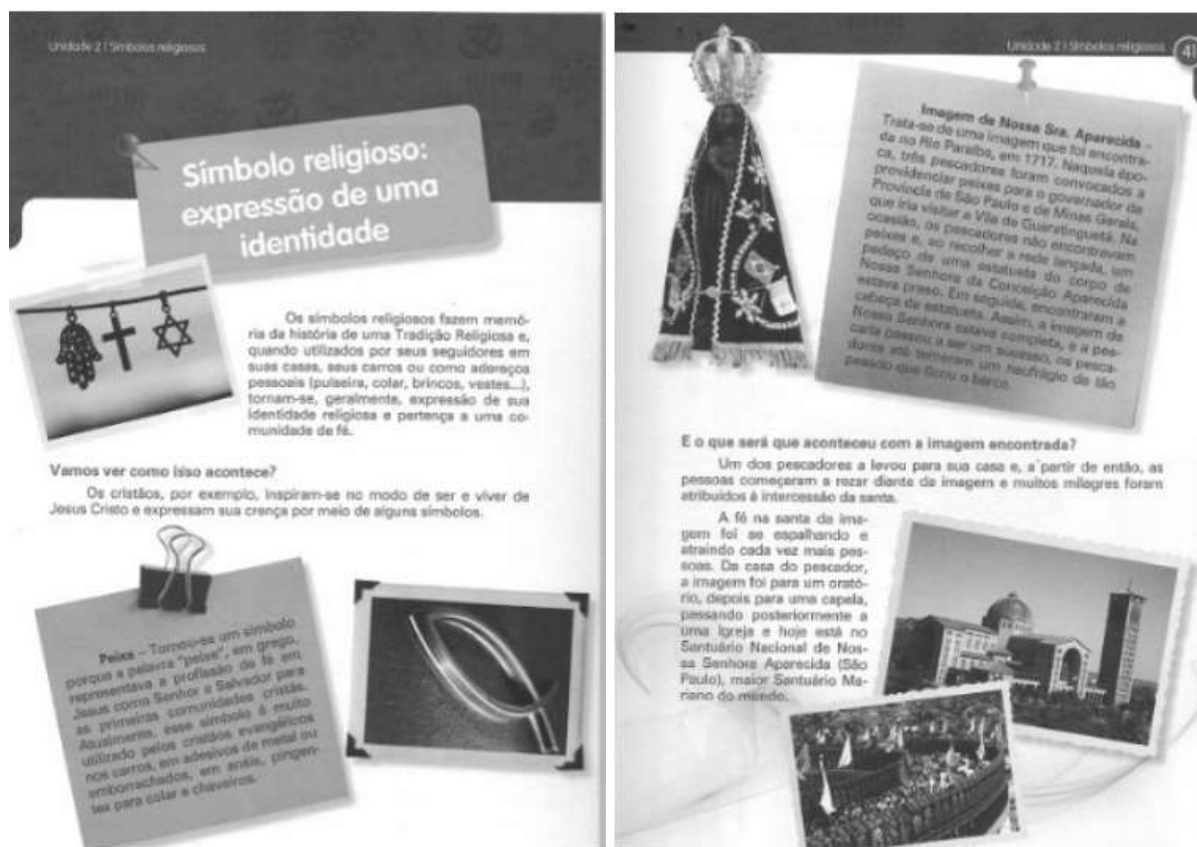
Figura 2: Coleção Redescobrimdo o Universo Religioso Livro do 5º ano.