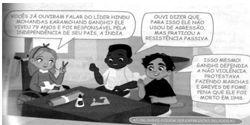
Figura 4: Coleção Ensino Religioso. Livro do 5º ano.

Fonte: Coleção Ensino Religioso. Livro do 5º ano (2016, p. 59) — Ilustração de Dayane Raven.