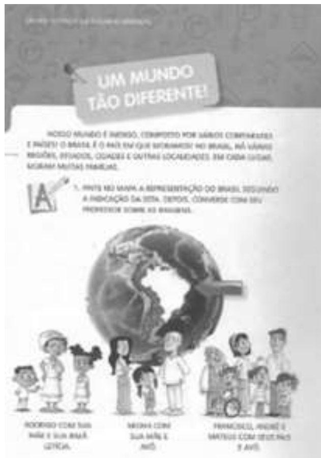
Figura 3: Coleção Redescobrimdo o Universo Religioso Livro do 1º ano.

Fonte: Coleção Redescobrimdo o Universo Religioso Livro do 1º ano. (2015, p. 8).