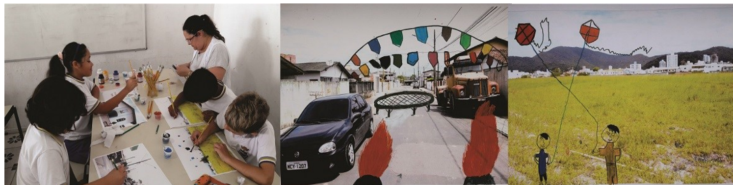
Figura 3—Alunos desenharam e pintaram sua interpretação dos bens culturais pesquisados sobre fotografias e algumas das intervenções artísticas realizadas.

Para montagem da exposição, os espaços onde se localizam as referências culturais do bairro foram fotografados sob a orientação das crianças da escola 4 . Posteriormente, foram feitas cópias em tamanho A3 dessas fotografias e, sobre essas reproduções, cada aluno realizou uma interferência artística, pintando e ex-