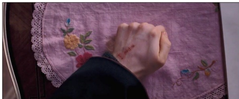
Imagem 2: Cena do filme Harry Potter e a ordem da Fênix que mostra a frase “não devo contar mentiras” se formando nas costas da mão de Harry.