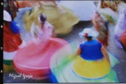
Maracatu - Nazaré da Mata