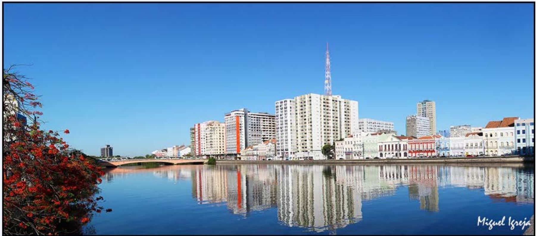
FOTOGRAFIA – Diversas linguagens